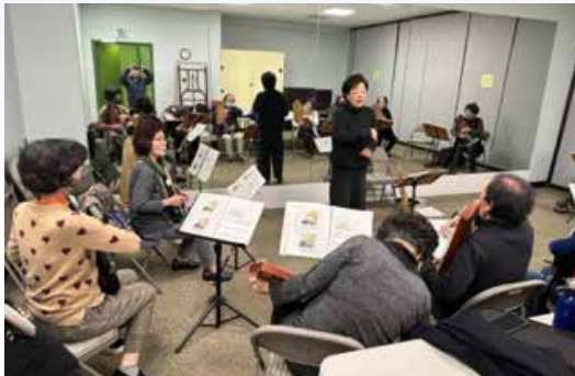
<노아대학 크로마 하프>

오전 수업을 마치고 11:30분에는 매주 교역자님들이 말씀을 전해 주시는 예배 시간이 있다. 하나님께 찬양과 말씀으로 영광을 올려드리고 육의 건강을 위하여 맛있는 점심도 함께 드시며 노아대학 동료들과 교제도 즐기는 시간을 갖고 있다. 가을 학기에 베이 지역의 많은 분들이 노아대학에 와서 풍성한 하나님의 은혜를 누리시길 기도한다.