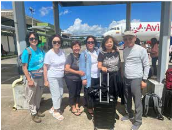
6월 12일 (월)