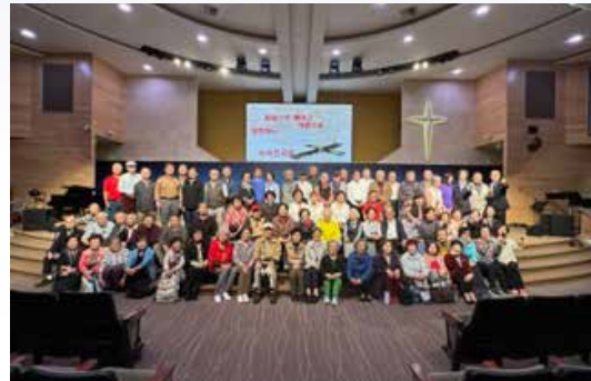
<노아대학 종강 단체사진>